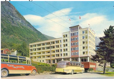
Hotel Alexandra 1962

I slutten av 50-åra starta utbygginga av det noverande hotellet. Fram til 1969 var hotellet eit sommarhotell, men vinteren 1968 / 69 vart den eldste delen av hotellet rive, og eit nytt og moderne bygg gav grunnlag for ei utvikling i retning av heilårsdrift. Hotellet starta med heilårsdrift frå ca 1974. Frå 80-åra vart det satsa på bygging av symjehall, utviding av kongressalar, nye rom, ny dansesal, utviding av hageanlegg og stadig oppussing av heile hotellet..