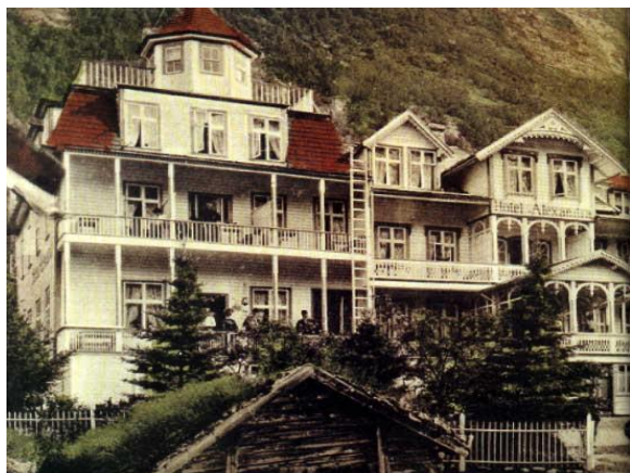
Hotel Alexandra 1891

Alexandra vart utvida fleire gonger før krigen, og etter utvidinga i 1934 blei hotellet eit av dei største turisthotella på Vestlandet. Men Kjendalsrestauranten gjekk det verre med, den blei teken av flodbølgja under Lodalsulukka i 1936