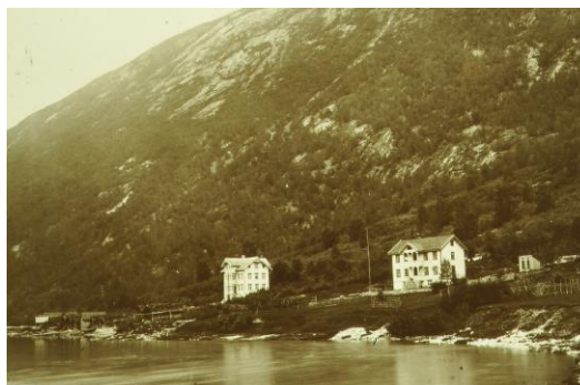
Loen's Hotell og "Kvamme's Hotell"