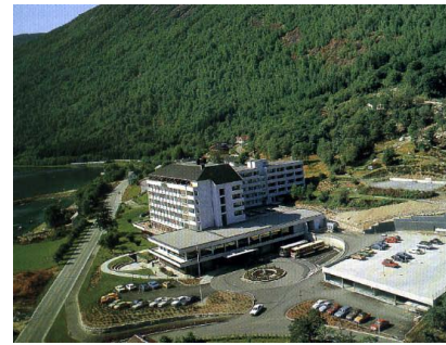
Hotel Alexandra 1981