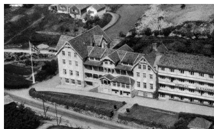
Hotel Alexandra 1934

Alexandra vart utvida fleire gonger før krigen, og etter utvidinga i 1934 blei hotellet eit av dei største turisthotella på Vestlandet. Men Kjendalsrestauranten gjekk det verre med, den blei teken av flodbølgja under Lodalsulukka i 1936