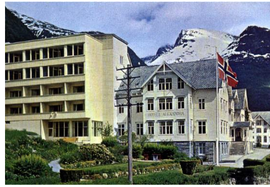
Hotel Alexandra 1957

I slutten av 50-åra starta utbygginga av det noverande hotellet. Fram til 1969 var hotellet eit sommarhotell, men vinteren 1968 / 69 vart den eldste delen av hotellet rive, og eit nytt og moderne bygg gav grunnlag for ei utvikling i retning av heilårsdrift. Hotellet starta med heilårsdrift frå ca 1974. Frå 80-åra vart det satsa på bygging av symjehall, utviding av kongressalar, nye rom, ny dansesal, utviding av hageanlegg og stadig oppussing av heile hotellet..